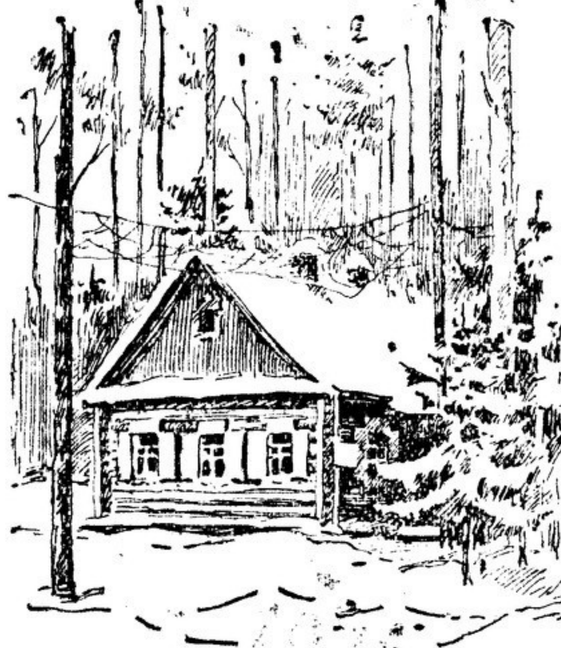
Рис. Л. КОТЛЯРОВА

По-солдатски проста и скромна обстановка командного пункта. Бережно сохранено здесь все так, как было тогда, когда в этом домике трудился товарищ Сталин. Замысловатый цвет сукованый скатерть покрывает письменный стол. На столе ничего лишнего — чернильный прибор и настольная лампа. Рядом с письменным столом неболь-