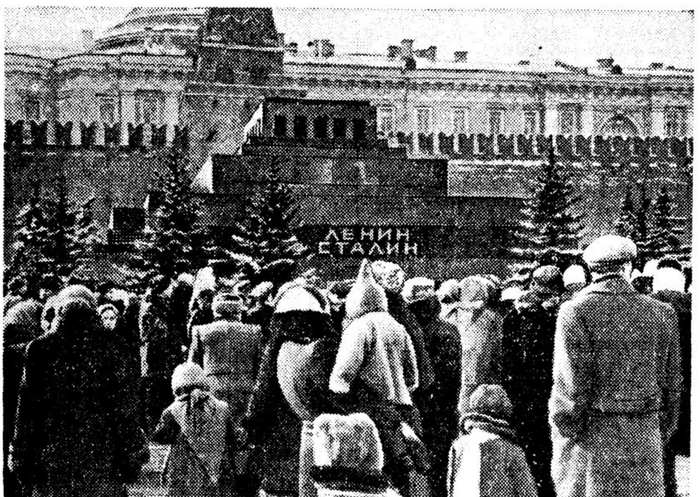
Вчера на Красной площади в Москве