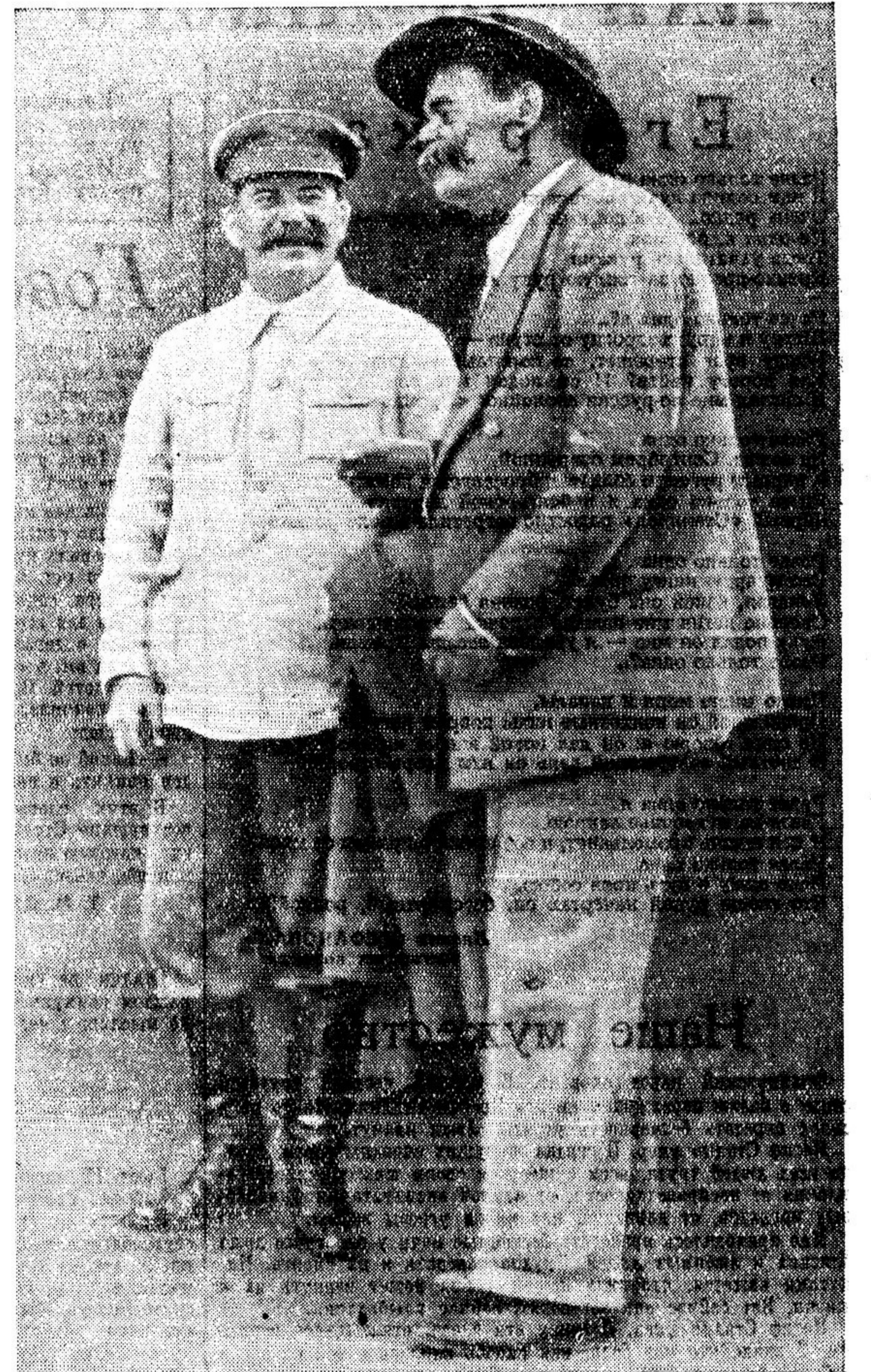
И. В. Сталин и А. М. Горький (1935 год)